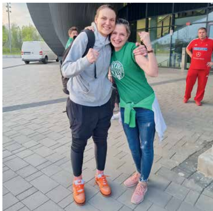
A szíve a Fradiért is dobog