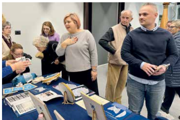
Látogatók a halasi csipke kiállítás előtt Olaszországban

– Nagy érdeklődés övezte az egyetlen magyar csipkét. Különlegesnek számított a készítményünk is, vagyis a tüvel,