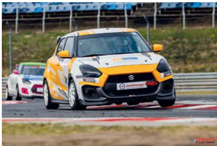
A 2025-ös versenyautó

– Nyolc-kilenc éves lehettem, amikor szüleimtől megkaptuk az első számítógépet. Volt rajta pár autós játék is, ami azonnal lekötötte a figyelmemet, órákat el tudtam játszani vele. A kezdetekben még csak billentyűzettel, majd pár héttel később már kormányval szeltem a virtuális pályákat. Ezt követően bukkantam rá egy online bajnokságra, ahol már hús-vér emberek ellen tudtam megmérkőzni. Innentől kezdve pedig már nem volt megállás. Nagyon sok mindent köszönhetek a szimulátoros éveknél. Kisgyerekként kezdtem, meg-