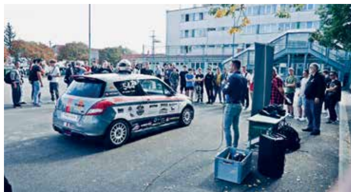
Előadás a Vári szakképzőben